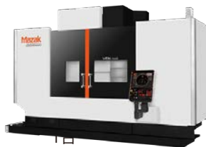
マシニング・5軸加工機 Mazak VCN-700D