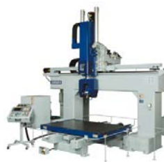
NC ルーター 庄田鉄工 NC7000U