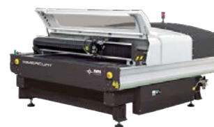
レーザー加工機 コムネット MERCURY609/1520