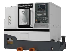
複合加工機 Nakamura Tome SC-100